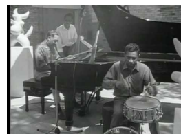
Duke Ellington Trio