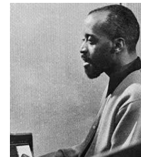
Junior Mance Trio