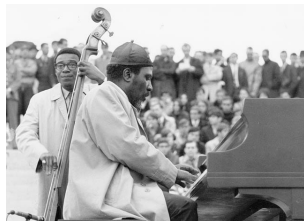
Thelonious Monk Trio