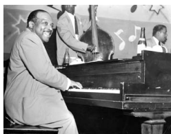
Count Basie Trio