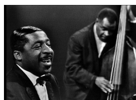
Erroll Garner Trio