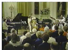
Chick Corea Trio