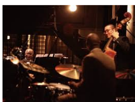
Hank Jones Trio