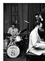
Jan Johansson Trio