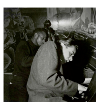
Horace Silver Trio