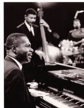
Wynton Kelly Trio