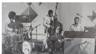
Ahmad Jamal Trio

Stockholm Jazz Trio startades i slutet av 2008 för att vid en konsert på Glenn Miller Café i Stockholm hylla den trio pianisten Oscar Peterson hade med Ray Brown på bas och Ed Thigpen på trummor mellan 1959 och 1964. Repertoaren bestod enbart av musik och arrangemang av Oscars berömda trio. Sedan dess har repertoaren utökats, och fastän fundamentet fortfarande är Oscar Peterson Trios musik förekommer nu arrangemang av andra kända jazzpianisters trior, till exempel: